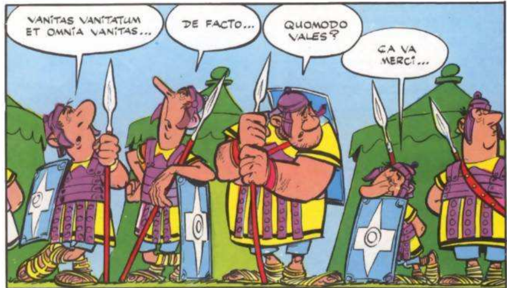
Goscinny, R., & Uderzo, A. (2013). Astérix-Astérix le Gaulois (No. 1). Hachette Asterix.