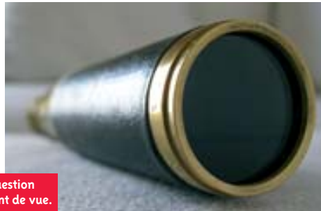
Une question de point de vue.